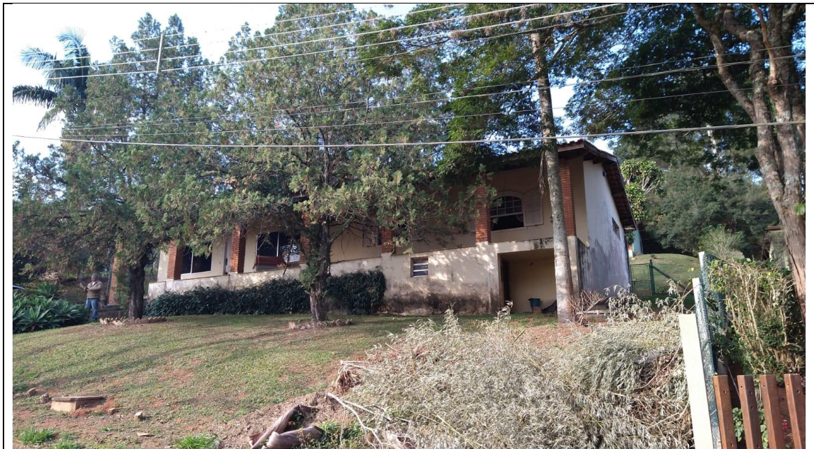
Três dormitórios, sendo duas suítes, um lavabo. Sala grande piso frio, lareira, cozinha.