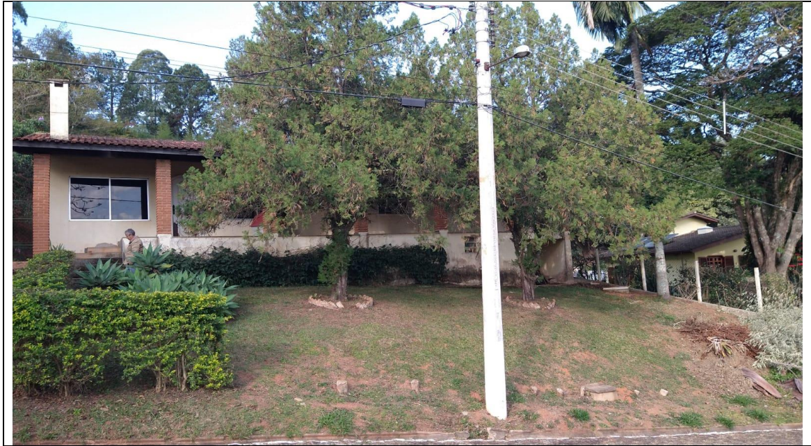
Garagem para três carros.